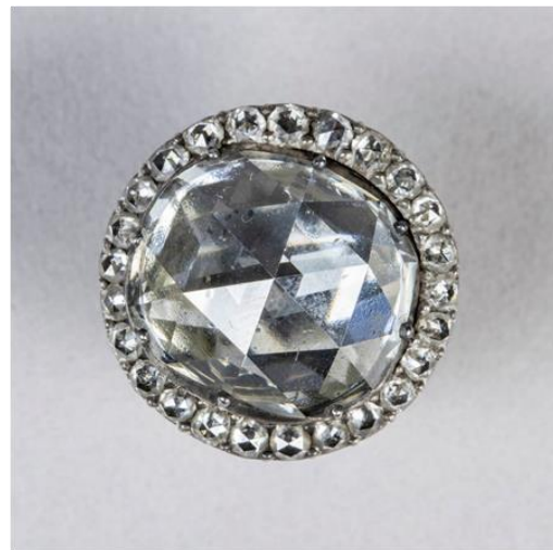
Abb. 1d: © Staatliche Kunstsammlungen Dresden, Grünes Gewölbe, VIII 9/1