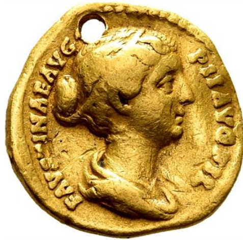
Abb. 1b: Münzkabinett, Staatliche Museen zu Berlin - Stiftung Preußischer Kulturbesitz, 18273315. CC BY-SA 4.0