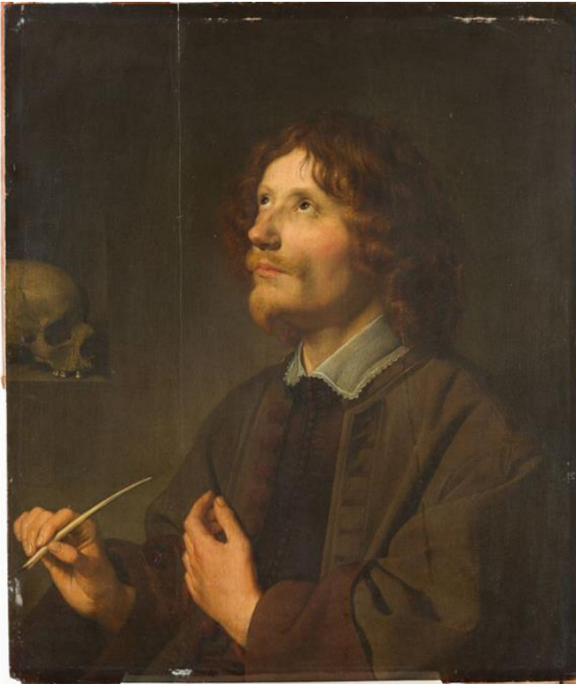
Abb. 1a: Georg-August-Universität Göttingen, Kunstsammlung der Universität, GG02. CCO 1.0